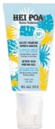
GELÉE FRAÎCHE APRÈS-SOLEIL 150 mL

⊕ La sua fragranza estiva prolunga il momento di piacere al ritorno dalla spiaggia e dalla piscina.