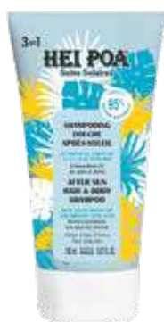
SHAMPOING DOUCHE APRÈS-SOLEIL 150 mL

L'1% del fatturato di HEI POA Suncare viene donato a questa associazione attraverso l'organizzazione mondiale « 1% FOR THE PLANET »