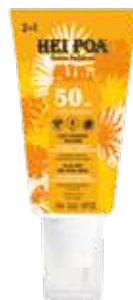
LAIT FONDANT VISAGE ET CORPS SPF 50 150 mL PROTEZIONE ELEVATA