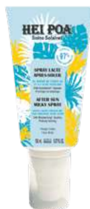
SPRAY LACTE APRÈS-SOLEIL 150 mL

⊕ Una vera ventata di freschezza, garantisce un'immediata sensazione di comfort. Idrata per 24 ore e previene la screpolatura della pelle.