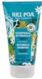
SHAMPOOING RÉPARATEUR AU MONOÏ DE TAHITI 150 mL

➕ Nutre e ripara le lunghezze e le punte di capelli secchi, danneggiati o fragili.