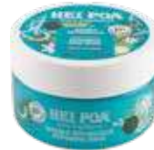
MASQUE RÉPARATEUR 200 mL

➕ Deterge, nutre e ripara. Aiuta a districare i capelli.