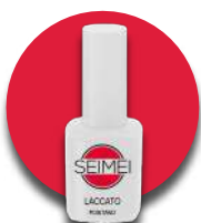
POSITANO Cod. 01-138