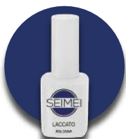
BOLOGNA Cod. 01-130