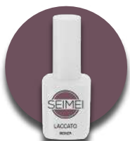
MONZA Cod. 01-110