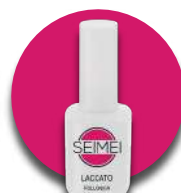
FOLLONICA Cod. 01-155