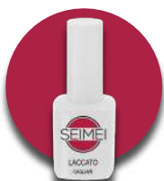
CAGLIARI Cod. 01-135