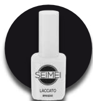
BRINDISI Cod. 01-112