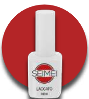
SIENA Cod. 01-134