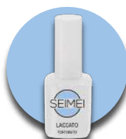
TORTORETO Cod. 01-180