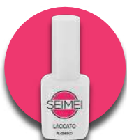
ALGERO Cod. 01-140