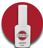
PONZA Cod. 01-169