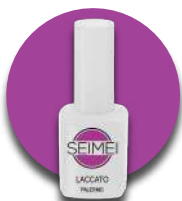
PALERMO Cod. 01-125