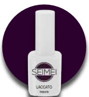
TRIESTE Cod. 01-114