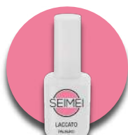
PALINURO Cod. 01-151