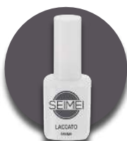
PARMA Cod. 01-179