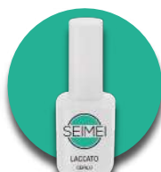
CEFALU' Cod. 01-154