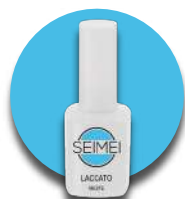
VIESTE Cod. 01-166