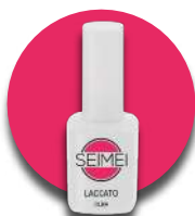
OLZIA Cod. 01-168