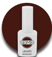
MONTEROSSO Cod. 01-177