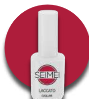
PORTOVENERE Cod. 01-175