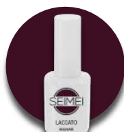
ANGIARI Cod. 01-159