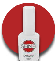
LIGNANO Cod. 01-174