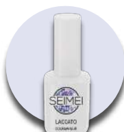
COURMAYEUR Cod. 01-148 HOLO GLITTER