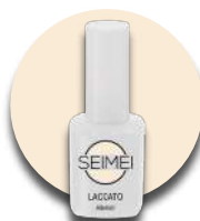
ASIAGO Cod. 01-165