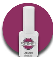
BARDOLINO Cod. 01-157