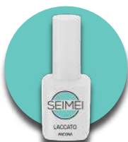
ANCONA Cod. 01-127