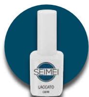
CAPRI Cod. 01-131