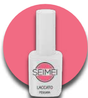
PESCARA Cod. 01-122