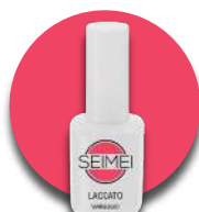
VIAREGGIO Cod. 01-153