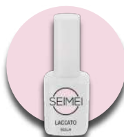
SCILLA Cod. 01-170