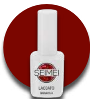
MANAROLA Cod. 01-164