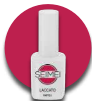
NAPOLI Cod. 01-121