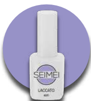
ASTI Cod. 01-128