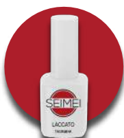
TAORMINA Cod. 01-137