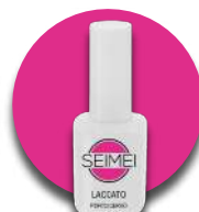
PORTOCERVO Cod. 01-145 FLUO