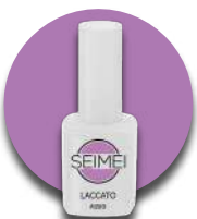
ASSISI Cod. 01-124