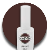
SPELLO Cod. 01-156