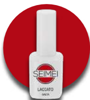
GAETA Cod. 01-162