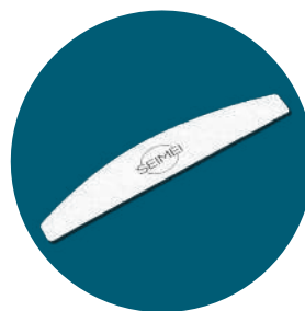
LIMA MEZZA LUNA