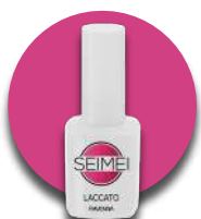
RAVENNA Cod. 01-120