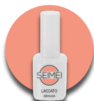
SIRACUSA Cod. 01-176