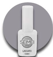
GUBBIO Cod. 01-161 GLIMMER