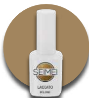
BOLZANO Cod. 01-163 GLIMMER