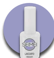
AQUILEIA Cod. 01-160