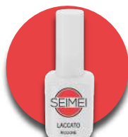
RICCIONE Cod. 01-143 FLUO