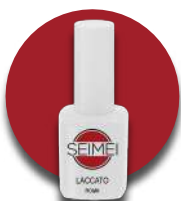
ROMA Cod. 01-133