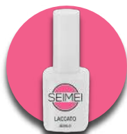
JESOLO Cod. 01-141 FLUO