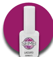
SORRENTO Cod. 01-150 HOLO GLITTER