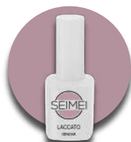
GENOVA Cod. 01-106