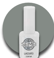
CORTINA Cod. 01-149 HOLO GLITTER