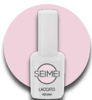
VERONA Cod. 01-103