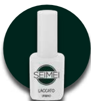
URBINO Cod. 01-132