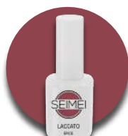
ERICE Cod. 01-158