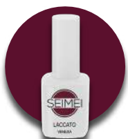
VENEZIA Cod. 01-115