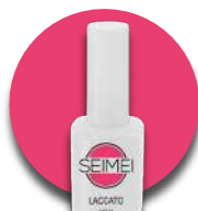
OSTIA Cod. 01-144 FLUO