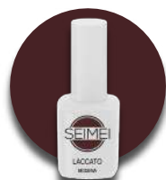
MODENA Cod. 01-111