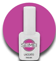
RAGUSA Cod. 01-126