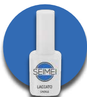
CAORLE Cod. 01-167