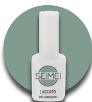
S.GIMIGNANO Cod. 01-178