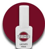
FIRENZE Cod. 01-116