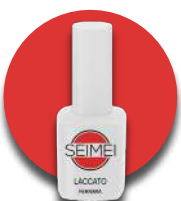
FERRARA Cod. 01-139