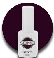
COMO Cod. 01-113