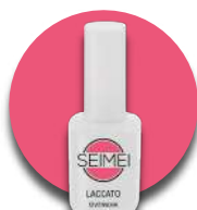
CIVITANOVA Cod. 01-152