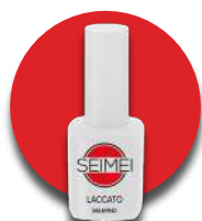
SALERNO Cod. 01-136