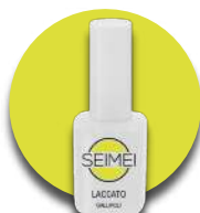
GALLIOLI Cod. 01-142 FLUO