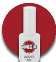
MARZAMENI Cod. 01-173