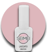
MANTOVA Cod. 01-104