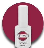
TRENTO Cod. 01-117