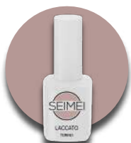
TORINO Cod. 01-108