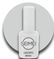
MERANO Cod. 01-101