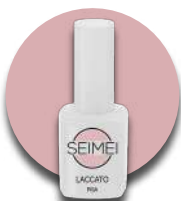
PISA Cod. 01-123