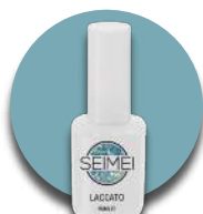
AMALFI Cod. 01-146 HOLO GLITTER