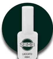
OTRANTO Cod. 01-172