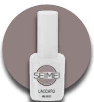
MILANO Cod. 01-109