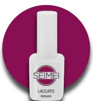
PERUGIA Cod. 01-119