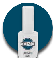
MARATEA Cod. 01-171