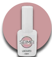
CHIETI Cod. 01-107