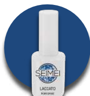
PORTOFINO Cod. 01-147 HOLO GLITTER