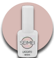
MATERA Cod. 01-105