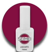
TROPEA Cod. 01-118