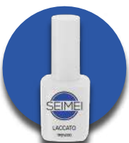
TREVISO Cod. 01-129