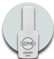
AOSTA Cod. 01-102